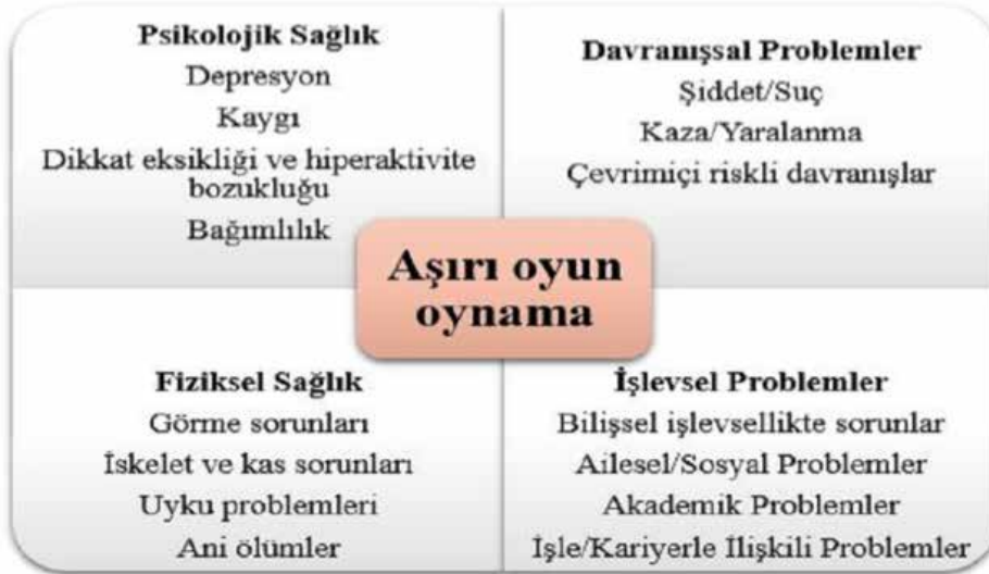
Şekil 2: Aşırı Oyun Oynamanın Sağlık Üzerindeki Etkileri (Lee, Lee ve Choo, 2016’dan çevrilerek uyarlanmıştır)

Dijital oyun bağımlılığı ciddiye alınması gereken ve pek çok olumsuz sonucu bulunan bir problem olarak görülmektedir (Kuss ve Griffiths, 2012). Dijital oyun bağımlılığının sağlık üzerine etkileri ve neden olabileceği diğer problemler Şekil 2’de özetlenmiştir.